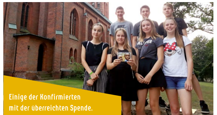
Einige der Konfirmierten mit der überreichten Spende.

Die Konfirmandinnen und Konfirmanden des Jahrgangs 2018-2019, die im Mai 2019 konfirmiert wurden, haben im März einen beeindruckenden Vorstellungsgottesdienst zu dem Brot für die Welt-Projekt in Sierra Leone gestaltet. Darin haben sie informiert über eins der ärmsten Länder der Welt, die Situation von Kindern und Jugendlichen dort und die Hilfe von Brot für die Welt und der Partnerorganisation SIGA. Nach ihrer Konfirmation haben die Konfirmierten sowie ihre Eltern einen Betrag in Höhe von 139 Euro für dieses Brot für die Welt-Projekt gespendet. Das ist großartig. Herzlichen Dank!